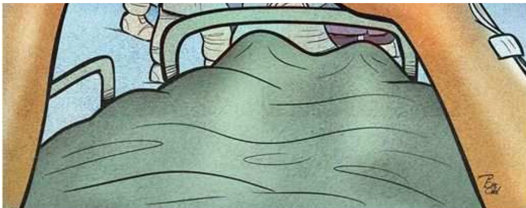
Artiste : Alireza Pakdel