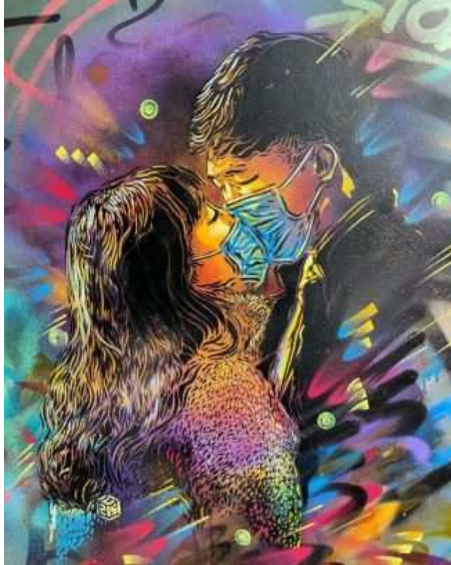
Artiste : C215